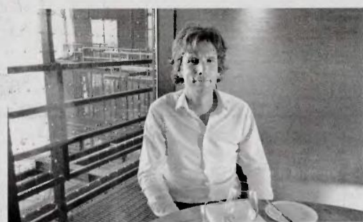
Μία από τις μεγαλύτερες αρετές σας είναι ο φιλικός και ανθρώπινος τρόπος με τον οποίο φέρεστε, ακόμη και όταν η καθημερινότητα έχει τόσο προβλήματα, λέει ο απερχόμενος Ολλανδός πρόεδρος Jan Versteeg.

— Τι συμβαίνει στην παρούσα φάση. Τι μπορούμε να κάνουμε για να ξαναζωτανεύουμε την οικονομία;